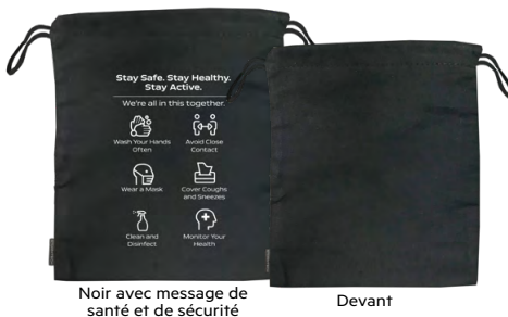
Noir avec message de santé et de sécurité

Gardez votre masque propre et en sécurité grâce à ce sac de rangement à cordon coulissant 100 % coton résistant à l'humidité.