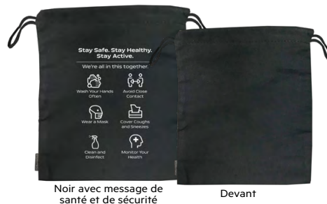
Noir avec message de santé et de sécurité

Gardez votre masque propre et en sécurité grâce à ce sac de rangement à cordon coulissant 100 % coton résistant à l'humidité.